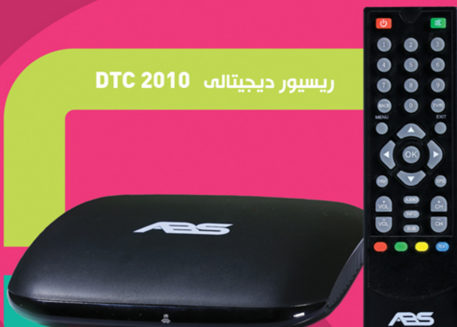
رسیور دیجیتالی DTC 2010

مرحله اول: کابل آنتن را به ورودی ATN عقب رسیور متصل نمایید. مرحله دوم: کابل HDMI و یا کابل سه فیش (سه لینه) را به تلویزیون و رسیور وصل نمایید. مرحله سوم: اگر لازم دارید تا سیگنال آنتن را روی دستگاه دیگر نیز استفاده نمایید در آنصورت یک طرف کابل حلقوی RF را در ورودی Loop out در عقب رسیور وصل نمایید و طرف دیگر کابل RF را به ورودی ATN رسیور دیگر وصل نمایید.