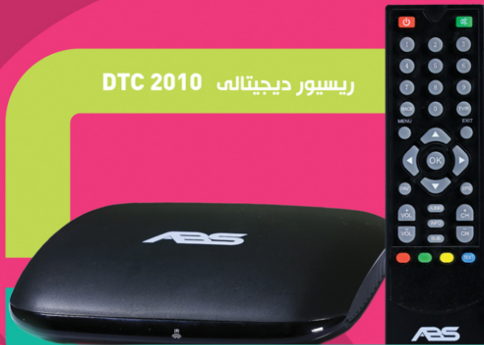
ریسور دیجیتالی DTC 2010

لومړی پړاو: د آنتن کیبل په ریسور کې د ANT په مخصوص ځای کې نصب کړئ. دوهم پړاو: د HDMI کیبل او یا درې غبرگه کیبل په تلویزیون او ریسور کې نصب کړئ. دریم پړاو: که چیرې اړتیا وي چې د آنتن سیگنال په بله د ستگاه کې وکاروئ نو په دې ترتیب د RF حلقوي کیبل یوه خوا د ریسور شاته په Loop out مخصوص ځای کې نصب کړئ او د RF کیبل بله خوا د بل ریسور په ATN ځانگړي ځای کې وصل کړئ.